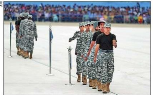
Air Force personnel unveil the new combat uniform during the IAF's 90th anniversary celebrations in Chandigarh on Saturday

The first lot of new officers for this new Weapon Systems Branch (WSB) in the IAF, cleared by the PM-led cabinet committee on security on Thursday, will be inducted by end-2023. The branch will be headed by an Air Marshal-rank (equivalent to Lt-Gen-