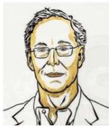
Douglas W. Diamond