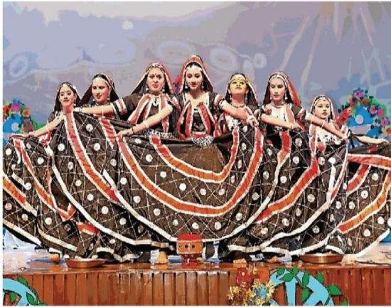
बुलंदशहर यमुनापुरम स्थित दिल्ली पब्लिक स्कूल के वार्षिकोत्सव में शनिवार को सांस्कृतिक प्रस्तुति देती छात्राएं • जगमग